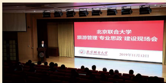
课程思政、专业思政一体化设计、一体化实施