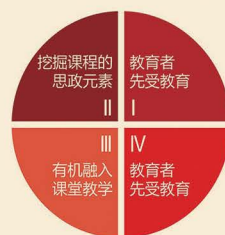
学校根据课程思政建设经验，提炼形成教师三项基本功