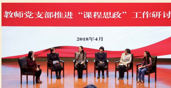
教师党支部推进课程思政工作研讨会