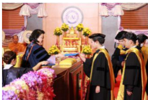
诗琳通公主为毕业学生授予学位

12. 学生待遇：学员可免费使用校园公共设施，包括图书馆、运动场所、校园医疗、无线网络。