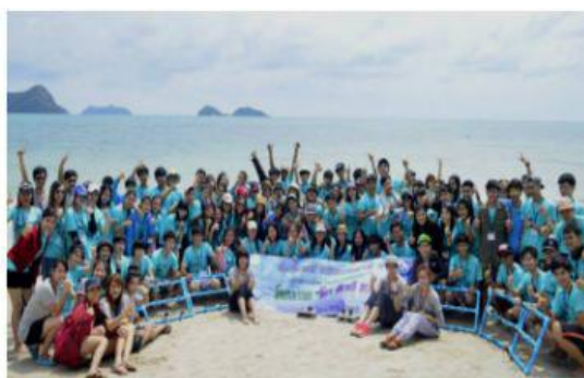
丰富多彩的校园活动