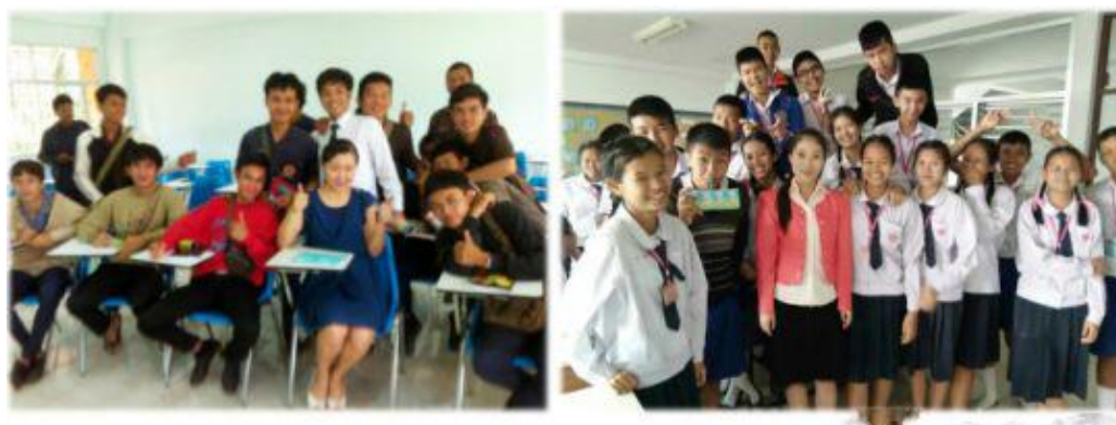
实习老师们和学生在一起

在读期间，可以在泰国公立中小学担任国际汉语教师，也可在泰国企事业单位带薪实习，既能积累教学经验，又能获得丰厚实习报酬，实习薪水每月约为 3000-6000 元。