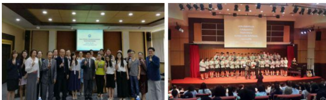
首届中国硕士研究生开学典礼

6. 师资强：由中泰两国顶尖高校著名专家担任导师并授课，包括来自北京大学、朱拉隆功大学等知名高校的专家。