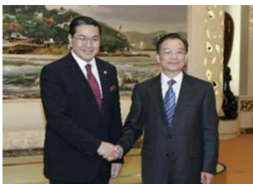
东亚大学理事长--素拉革

为落实中泰两国国家领导人加强教育文化领域合作会谈精神，为“一带一路”建设培养高级国际化人才，在泰国教育部大力支持之下，泰国东亚大学 2016 年开始招收教育管理硕士，目前第一批学生已顺利毕业。硕士学制 2 年。由泰国著名专家担任导师并授课。