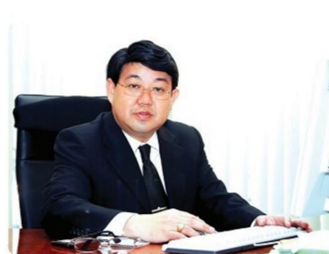
东亚大学校长--查瓦尼

泰国东亚大学是泰国著名的高等学校之一，东亚大学理事长为东南亚著名政治家、现任亚洲和平和解理事会主席、泰国前副总理、外交部长素拉格先生，东亚大学创办以来以高质量的教育和科研成果得到了教育界普遍赞誉。目前泰国东亚大学有泰国学生及外国留学生 4000 多名，其中包括 200 余名中国留学生。泰国东亚大学开设有学士、硕士研究生、博士研究生，共 35 个专业，涵盖文、理、商、医等学科。